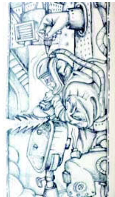
Arriba, a la izquierda: "Insert coin". 36 x 36 x 41 cm. Bin. China Clay, Blue Cobalt on white, glaze cone 10. Kohler 2016. Arriba, a la derecha: "Wayfarer". 36 x 36 x 41 cm. Bin China Clay, Blue Cobalt on white, glaze cone 10. Kohler 2016. Izquierda: "He who toils here hath set his mark". 190 x 110 x 51 cm. Tiles and urinal. China Clay, black stain on white glaze, cone 10, Kohler 2016. Centro: "Cuaderno". 31 x 21 cm. Paper, ink and watercolor. Kohler 2016. En la otra página: "Be careful what you wish for...". 66 x 66 x 35 cm. Toilet. China Clay, blue cobalt on white glaze cone 10. Kohler 2016.

"Created in Arts/Industry, a long-term residency program of the John Michael Kohler Arts Center in Sheboygan, Wisconsin. Arts/Industry takes place at Kohler Co."