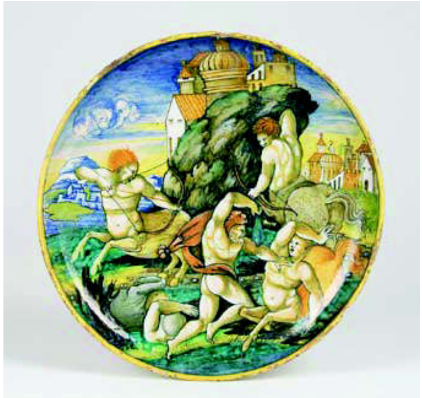
Coppa, Pesaro (Italia), Pintor de Argo, circa 1540 circa. Museo Faenza. Exposición "The legacy of 1000 years of Italian ceramics"