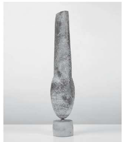
Hans Coper. (Alemania, 1920 - Reino Unido, 1981). Forma "cicládica", circa 1967. Gres, porcelana y engobes. Colección privada. Se adjudico por 8.500 libras en Maak Contemporary Ceramics. Reino Unido

de Hong Kong por 36 millones de dólares, mientras la cerámica turca Iznik sigue subiendo su cotización, en Christies un cuenco decorado en tonos azules se ha rematado por 1.13 millones de euros. Otros como el coleccionista anónimo que ha ofrecido su Aston Martin valorado en medio millón por una cerámica de Huang Cheng-nan del grosor de una cáscara de huevo, concretamente algunos de sus cuencos de 30 cm pueden tener un grosor de pared de 1 mm, inclusive algunos cuencos de 20 cm pueden tener un grosor entre 0.15 y 0.18 mm, supuestamente grosores de porcelana mas finos que el cuenco Jindae, conocido como el cuenco mas fino del mundo. Las Subastas Maak Contemporary Ceramics Auction has subastado una espléndida colección de cerámica contemporánea, con cerámicas de Bernard Leach, Shoji Hamada, Lucie Rie y Hans Coper, entre otros. ( www.maaklondon.com ).