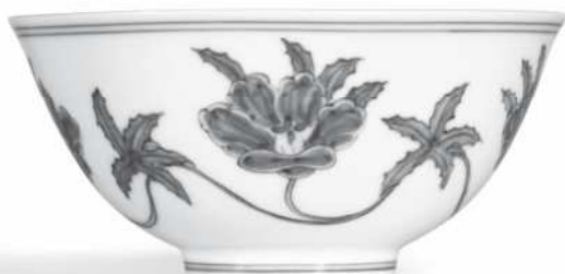
Cuenca azul y blanco del periodo Chenghua (siglo XV) subastado por Sotheby's por 18 millones de dólares.

En las Subastas Sotheby's de Hong Kong se ha subastado un cuenco azul y blanco de palacio del periodo Chenghua (siglo XV) por 18 millones de dólares, supuestamente adquirido por el coleccionista William Chak, mientras en la sede de Nueva York se celebran subastas como "Fine Chinese Ceramics" ( www.sothebys.com ) y las subastas Christie's han ofrecido la colección Riesco con piezas muy importantes de varias dinastías chinas. ( www.christies.com ). La cerámica, el vidrio o la madera de grandes artistas han alcanzado remates interesantes: George Nakashima obra en madera 110.500 dólares, una pieza de cristal de Dale Chihuly 25.620 dólares; obras en cerámica de Gertrud y Otto Natzler entre 41.125 y 252.000 dólares; Ken Price 114.562 dólares; Peter Voulkos 105.720 dólares y Lucie Rie entre 18.800 y 32.000 dólares. La cerámica de Picasso comienza a ser considerada como una obra más del genial malagueño, aunque los precios de los cuadros son infinitamente superiores.