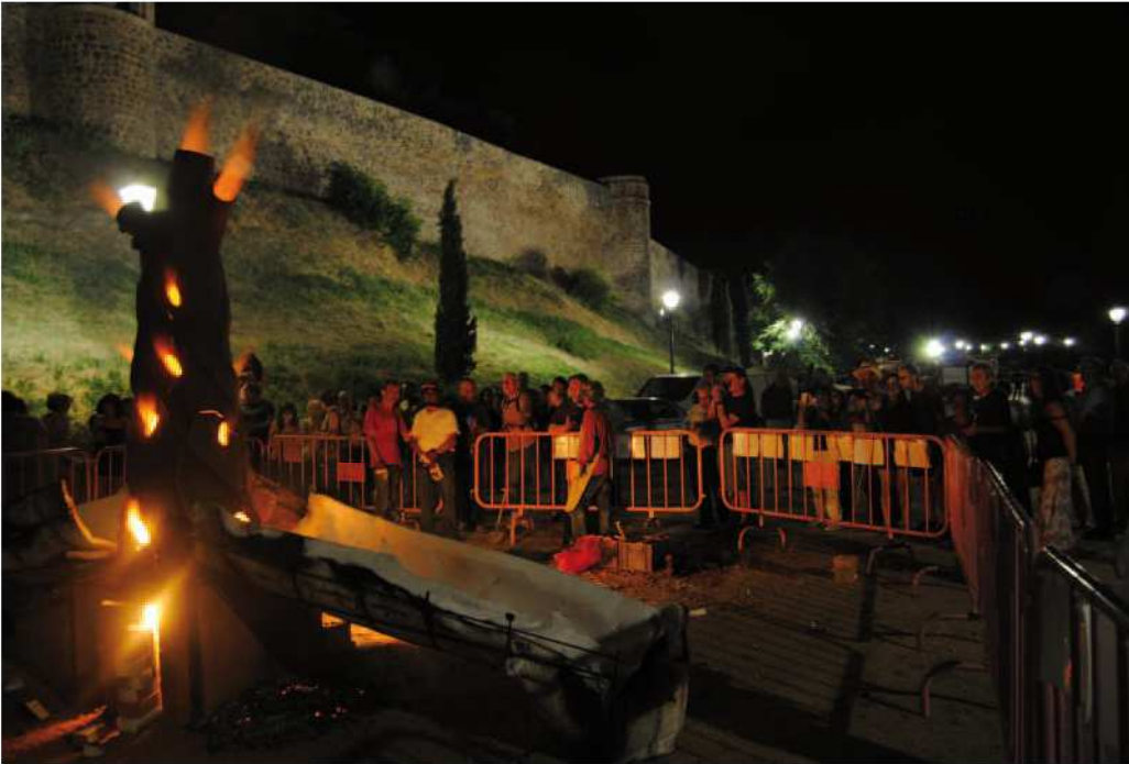
"Árbol de fuego" en Toledo.