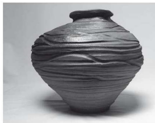
Monona Álvarez. Tudela de Duero.

Sylvia Hyman. "Tomato Box with Blueprints", 2003. Gres y porcelana. 36 x 27 x 36 cm.