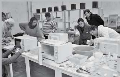
Imágenes de cursos realizados por Infocerámica.com en Almonte (Huelva), Tránsito de imagen sobre cerámica; Ajalvir (Madrid), uso de horno microondas en cerámica, y Pelahustán (Toledo), rakú con esmaltes mates