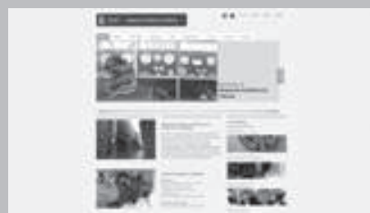
Museu de Cerámica de l'Alcora www.museualcora.es