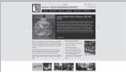
Robert Yellin Yakimono www.japanesepottery.com