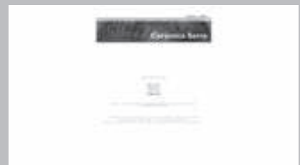
Cerámica Serra www.ceramicaserra.com