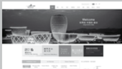
La Cerámica Internacional en Liling www.cncigu.com