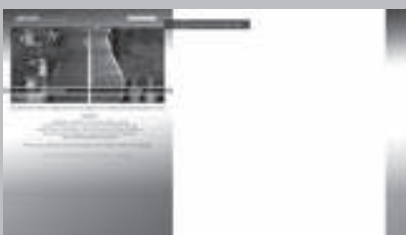
Glaze simulator www.glazesimulator.com