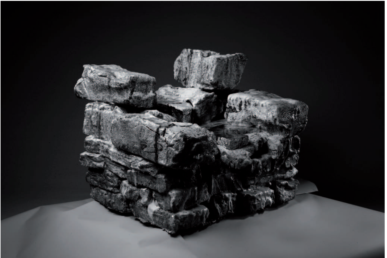
Kojima Osamu. "Nostalgia TW-01". Medalla de Oro en la Bienal de Cerámica de Taiwan.