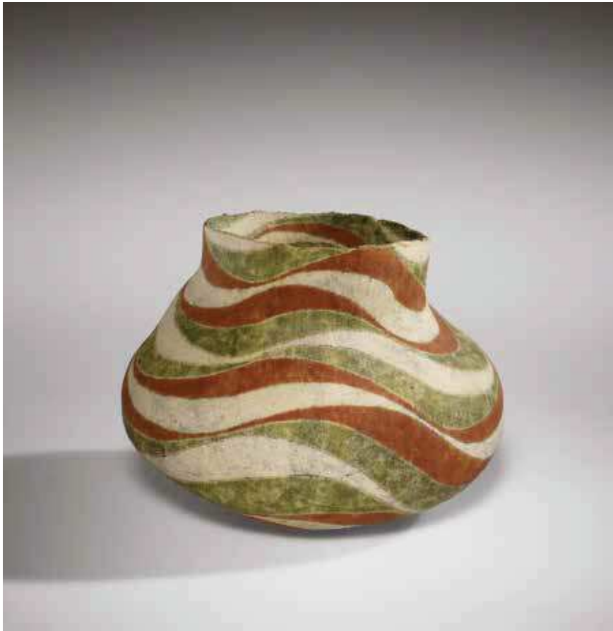
Izquierda: Shoji Kamoda, «Jar», 1971. Gres y esmaltes. 11 x 16,6 cm.

nales de Cerámica (ANPEC) ha celebrado una exposición con el título “Jocs de Terra i Foc” en la Casa de Cultura de Alcoi, con juegos y juguetes de cerámica ( http://anpec-ceramica.blogspot.com ).