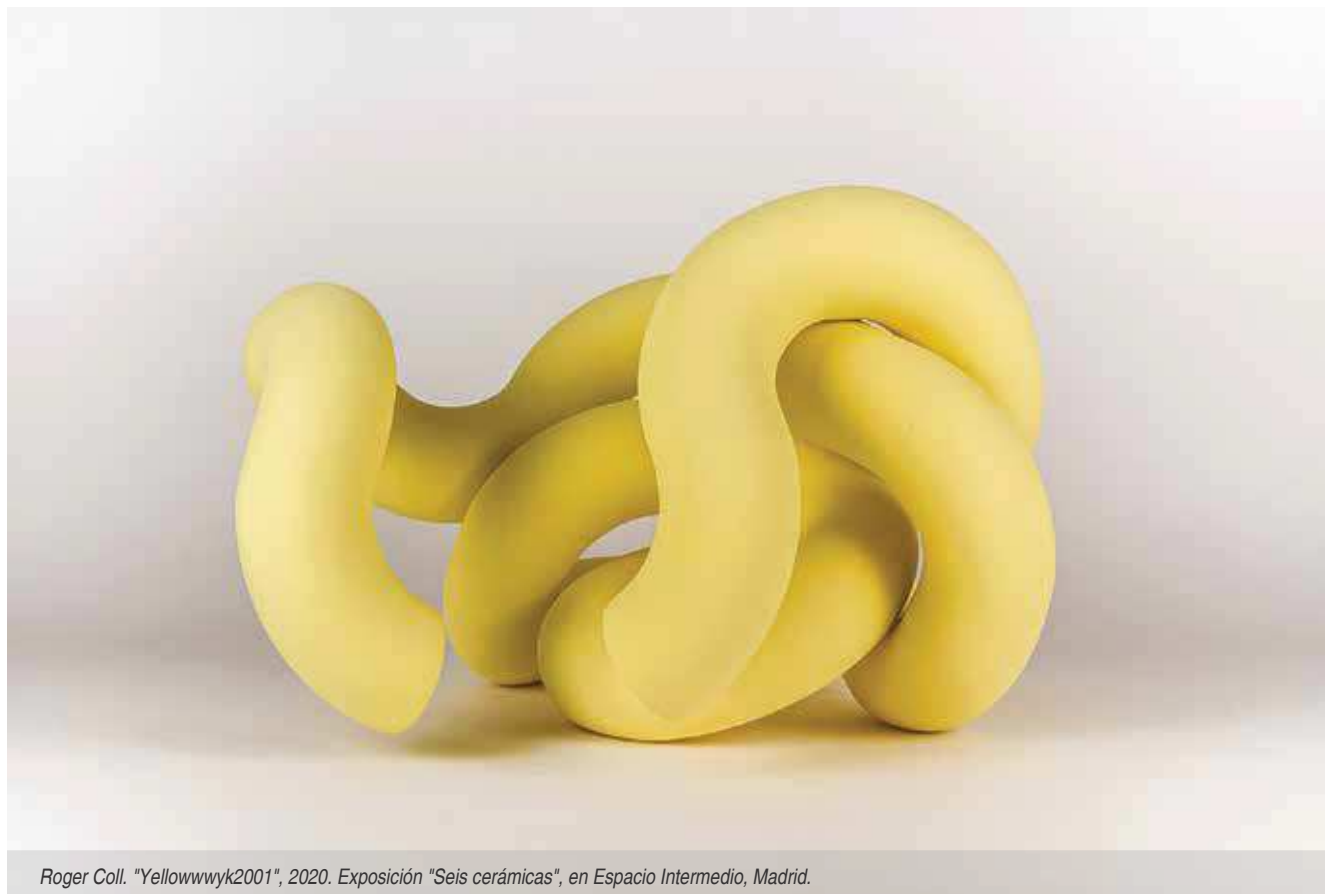
Roger Coll. "Yellowwwwk2001", 2020. Exposición "Seis cerámicas", en Espacio Intermedio, Madrid.

CAMIL-LA PÉREZ SALVÁ Al Moli de Cal Xerta El Cami dels Moli Moli de Cal Xerta Carrer de Baix, 32