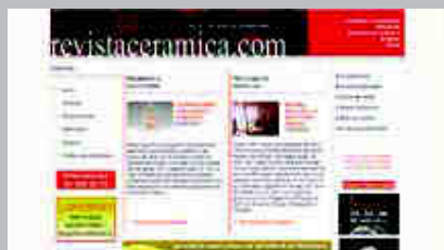
Revista Cerámica www.revistaceramica.com