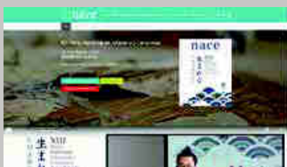
Feria NACE www.ferianace.com/

En internet hay información de casi todo, aunque en ocasiones es muy breve y con clara preponderancia de todo lo que ocurre en el mundo anglosajón y el