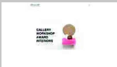
Officine Saffi www.officinesaffi.com