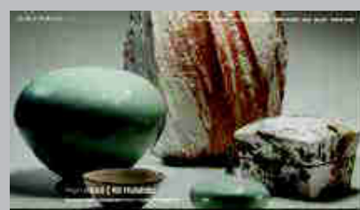
Mirviss Gallery www.mirviss.com