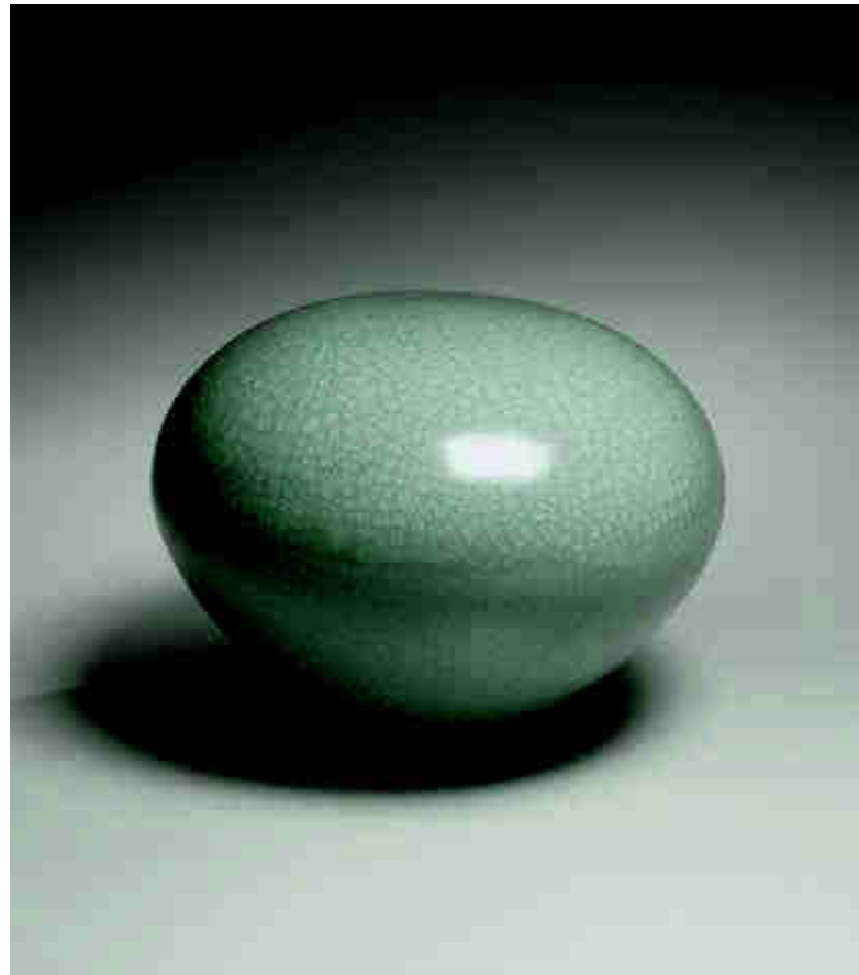
Izquierda: Hori Ichirō (Japón, 1952). Vasija "Kinuta" de estilo "Ki-Seto" (Seto amarillo), 2019. 25,4 x 11,5 x 10,8 cm. (Foto: Richard Goodbody. Courtesy Joan B Mirviss LTD.) Arriba: Itō Hidehito (Japón, 1971). "Space", 2020. Escultura de porcelana con esmalte celadón craquelado. 22 x 30,5 cm. (Foto: Richard Goodbody.) Abajo: Itō Hidehito. Cuenco de porcelana con esmalte celadón craquelado, 2021. 18,4 x 54,7 cm. (Foto: Richard Goodbody.)