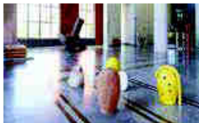
Escultura de Xavier Toubes en la exposición en la sede del Banco de España, en Madrid.

Ahora hay muchos cursos online , como el ofrecido por el Museo Nacional de Artes Decorativas "Introducción a la Cerámica Histórica Española" de Abraham Rubio Celada ( www.amigosmnad.com ).