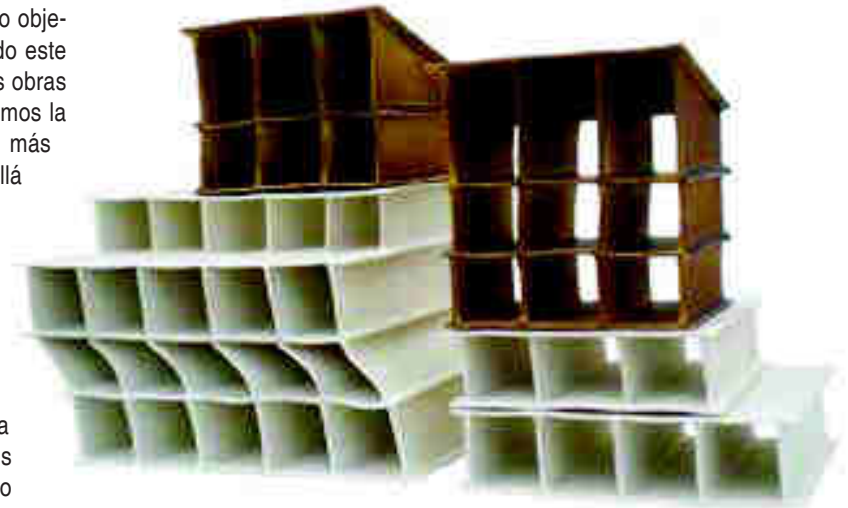
Arriba: José Cuerda. "Bloque 1", 2007. Porcelana con papel y esmaltes 1270 °C. 38 x 70 x 14cm. (las dos 2 piezas). Arriba, a la izquierda: José Cuerda. "Moradas 2", 2008. Porcelana con papel y esmaltes 1270 °C. 41 x 70 x 29 cm. (las 2 piezas).

La inspiración de José Cuerda es trabajar todos los días, en-