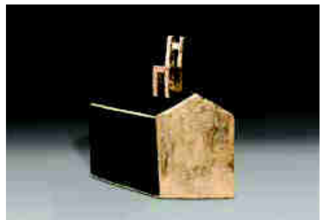
A la derecha. Arriba: Ximena Ducci. "Dos Casas bajo roca", 2019. Gres blanco y oro en 3er fuego. 27 x 20 x 33 cm. Centro: Ximena Ducci. "Casa de la abundancia", 2019. Gres blanco y oro en 3er fuego. 27 x 28 x 32 cm. Abajo: Ximena Ducci. "Casa buena vista", 2018, Gres y oro en 3er fuego. 44 x 15 x 41 cm.