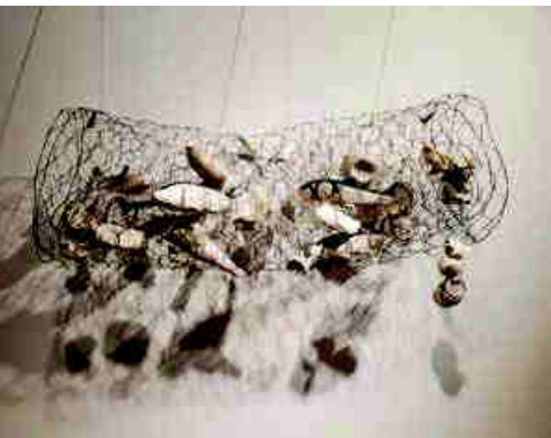
Izquierda: "Atrapado por el progreso". Arriba: "Genio y figura". Más arriba, a la derecha: "Soneto Lope de Vega". Más arriba, a la izquierda: "Luna".