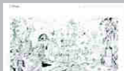
Xavier Monsalvatje www.xaviermonsalvatje.com