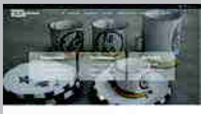
Museo Dieulefit www.maisondelaceramique.fr