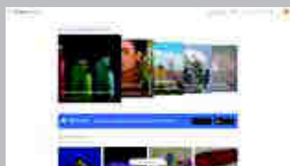
Google Arts and Culture https://artsandculture.google.com