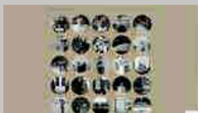
Diario de un ceramista http://diariodeunceramista.wordpress.com