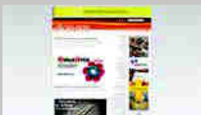
Oficio y Arte www.oficioyarte.org

Las redes no han hecho los cambios estructurales necesarios y nosotros pagamos el precio, parece ser que Google acumula sanciones por un valor de 8.250 millones de euros, la mayoría recurridas. Los gigantes tecnológicos codician toda nuestra atención para subastarlas en el mercado de la atención, lo que algunos autores de libros llaman el capitalismo de la vigilancia, todo lo que mueve las redes sociales es inmenso y son gratuitas pero solo en apariencia, el producto es nuestro tiempo, resulta curioso cuando consultas algo de productos de cerámica, casi de forma inmediata se nos anuncia donde comprarlo, probar con bentonita cerámica. Hay una sinergia entre Microsoft, Apple, Google y Amazon, curiosamente esta última se gasta 55.2 millones de dólares en publicidad de Google. Regalamos información valiosa sobre nuestros gustos, consumo, opiniones y lo que haga falta, de cualquier forma las empresas venderán al mejor postor y que volverán en forma de publicidad, estamos todos en el entramado de compra y venta. Google, Microsoft, Amazon y Facebook saben todo sobre nosotros y esa valiosa informa-