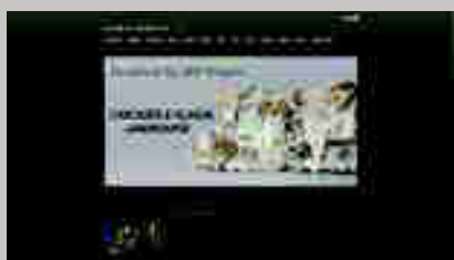
Galeria Joan B. Mirviss www.mirviss.com