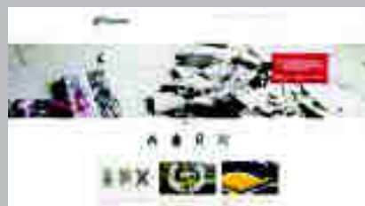
Videos de Artesanía https://createday.org/videos/xavier-toubes/