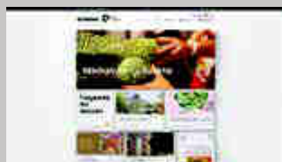
Museo Ariana www.musee-ariana.ch