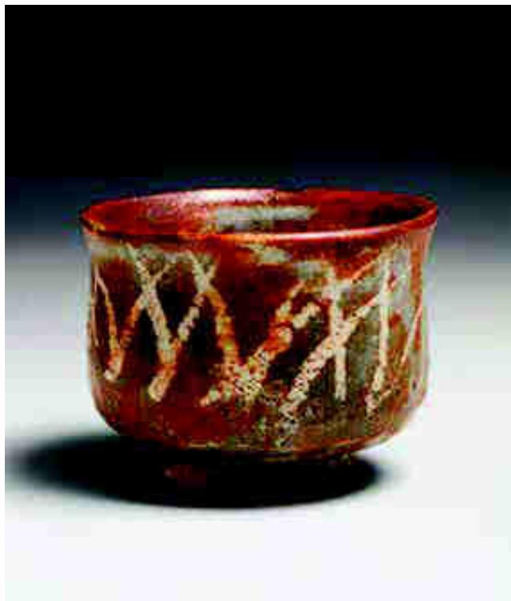
Arriba, a la izquierda: Kitaoji Rosanjin. Cinco platos decorados con hojas de arce verdes y rayas plateadas, ca. 1955-58. 20 cm de diámetro. Arriba, a la derecha: Kitaoji Rosanjin. Cuenco de té "Nezumi-Shino" decorado con patrones de celosía. ca. 1958. Gres esmaltado. 8,5 x 11,8 cm. Abajo: Kitaoji Rosanjin. Plato en forma de abanico con esmalte "Oribe", decorado con brochetas de "mochi". ca. 1940. 7 x 28,3 x 24,8 cm.