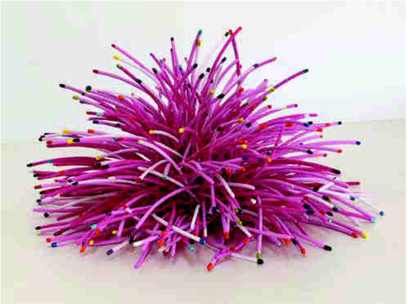
Arriba: Bean Finneran. "Fuchsia Mound".