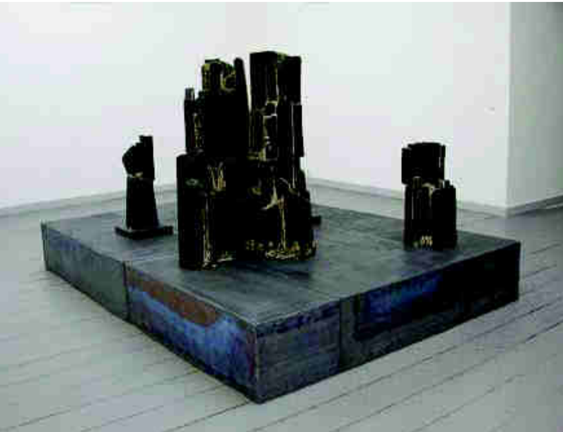
Izquierda: "Leaden Landscape", 2002-2008. Instalación. Plomo, objetos de cerámica. fotografía y proyección de imagen. Abajo: "Architectural constructions", 2015-2017.

> "In Between Sculpture" lo que confirma su compromiso con la escultura cerámica, son esculturas de tonos de cierta calidez, rojizos, marrones, todo muy cerámico.