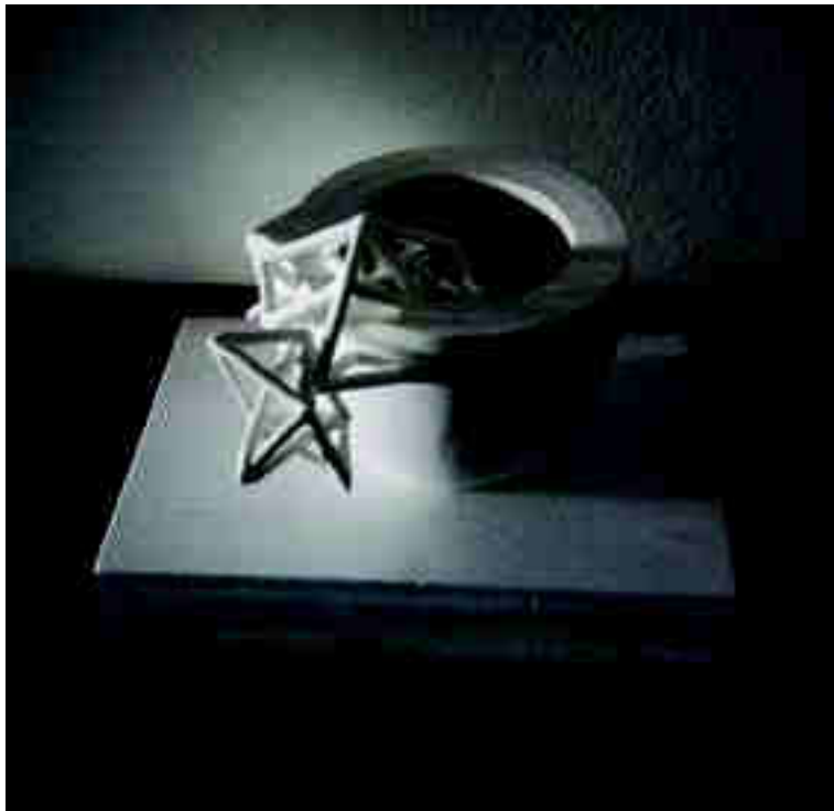
Arriba: "Gresol". Más arriba: "Eó". Derecha: Vista de la instalación "Contingent".

y hacen de la cerámica una forma de expresión de las vanguardias de la corriente principal del arte, gracias a la fuerza expresiva de Lluís Xifra. La obra titulada "Connexio divina" explota toda la expresión de una composición modular de formas cerámicas irregulares, posiblemente deformadas, con contrastes de forma y color. Las series "Columnes" y "Columnes II" son de una presencia muy poderosa, por su secuenciación de formas y por sus contrastes de relieves y su impresionante tamaño. Mientras en las composiciones bidimensionales, con rasgos de mural o si se quiere composición de cuadro encontramos la obra titulada "Multiples" con sugerentes relieves como forma de contrastes y profundos relieves. Por su parte la obra titulada "Encadenades" se desarrolla horizontalmente, encajando diversos niveles de composición continuada en el espacio de crecimiento, con mayor verticalidad dentro del mismo lenguaje >