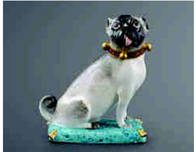
Arriba: Carlin assis, circa 1745. Porcelana; alto, 10,8 cm. Colección privada. Porcelana de Meissen. Izquierda: Flacon, circa 1725. Porcelana; Alto, 10,8 cm. Colección privada. Porcelana de Meissen.

En la otra página. Rosa Vila-Abadal y Jordi Marcet. "Retratos de ceramistas".