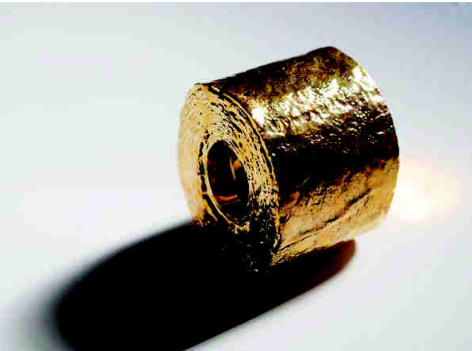
Arriba: "Horus", 2020. Porcelana, 14 x 12 x 12 cm. En la otra página: "Secciones IV", 2019. Porcelana, 11 x 30 x 16 cm.

En las piezas de la serie "Sobrepeso" más llenas de carga simbólica, algunas de las cuales son de gran impacto visual, básicamente cuerpos apresados en la piedra más rotunda, alas que sugieren que la piedra podría echar a volar, las manos que quieren un contacto más íntimo para escapar de un mundo tan agreste y muchas cosas más, pero la obra más repleta de significado es el "Monumento a las Víctimas Eldenses deportadas en los campos de concentración nazis", una obra sobrecogedora que nos recuerda nuestro más triste e injusto pasado, ver los números grabados en pierna y brazo provoca los recuerdos del pasado que debemos avergonzarnos sin remedio, ni miramientos o excusas. Y aquí nos sirve de reflexión las propias palabras de Carlos Martínez García "Lastre, carga, pesadez...tantas palabras que nos recuerdan lo >