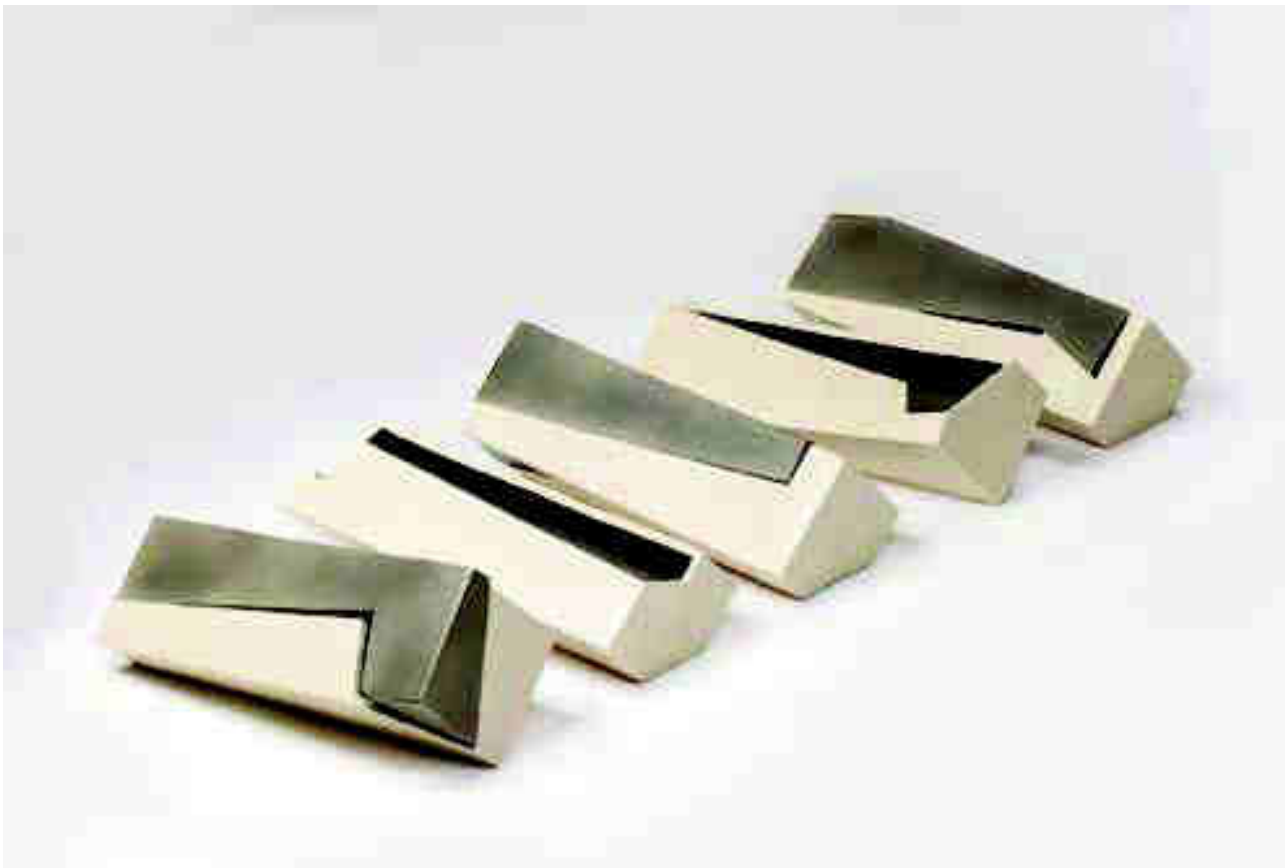
Arriba: Serie "Cifrados". En la otra página. Arriba: Serie "Cabeza de línea". Abajo: Serie "Batientes".

murales, esculturas cerámica y piezas, con terra sigillatas de una gran variedad cromática y elementos compositivos de contraste muy sutil, inclusive estos mismos elementos tienen un aura como marcas de fuego. En 2012 gana el Premio "Memorial Joan Capdevila" con unas piezas de su popular serie "Rotativos" (pág. 90, núm. 125). Manuel Velázquez con un brillante texto aclara muchas cosas de Molet, incluidas algunas claves de su lenguaje artístico, aquí brilla con luz propia la serie "Batientes" con piezas que conquistan el espacio con expresiones circulares con brillantes colores dentro de su fiel aliada la terra sigillata (págs. 1 y 78, núm. 131 de 2013). Como buen aragonés su participación en Cerco es importante, inclusive en la edición de 2015 consigue el Primer Premio de la Bienal con una composición de formas tituladas "Anatomía de la Forma" (pág. 78, núm. 137). En un artículo que empieza con el subtítulo "Arte en un Sigillium actual", mencionado anteriormente, encontramos más obras cerámicas de la serie "Anatomía de la serie" aunque aquí encontramos un cromatismo muy sutil con marcas de fuego como contraste de una bella superficie de terra sigillata más o menos blanca y un borde que marca el relieve