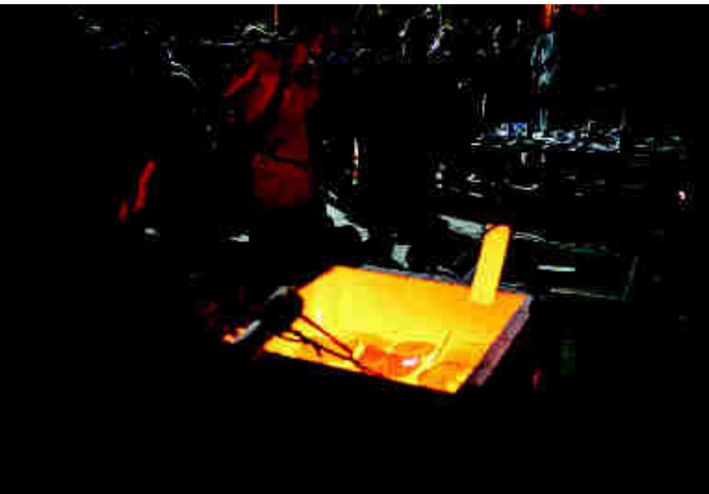
Izquierda: Raku en la Escuela de Cerámica de la Moncloa, en Madrid. En la otra página: Feria de Alfarería y Cerámica de La Rambla "En Barro".