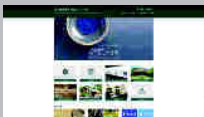
Museo de Cerámica de Mashiko www.mashiko-museum.jp