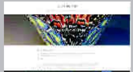
Judith de Vries www.judithdevries.com