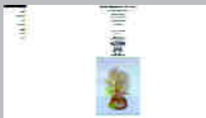
Galería Carla Koch www.carlakoch.nl