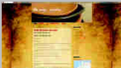
Julia Sanges www.juliaceramica.blogspot.com