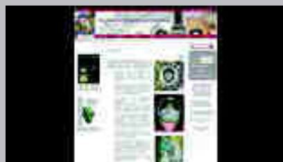
Associació Catalana de Ceràmica www.acatceramica.com