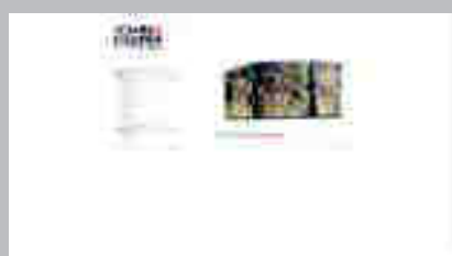
Xohan Viqueira www.xohanviqueira.com