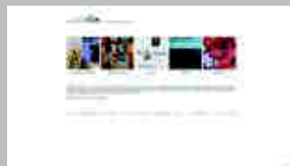
Galería Spazio Nibe www.spazionibe.it