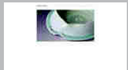
Takeshi Yasuda www.takeshiyasuda.com