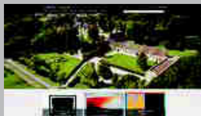
Galería Capazza www.galerie-capazza.com