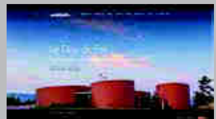
Galerie Du Don www.galeriedudon.com