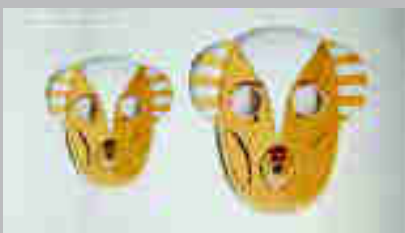
Jaime Hayon www.hayonstudio.com