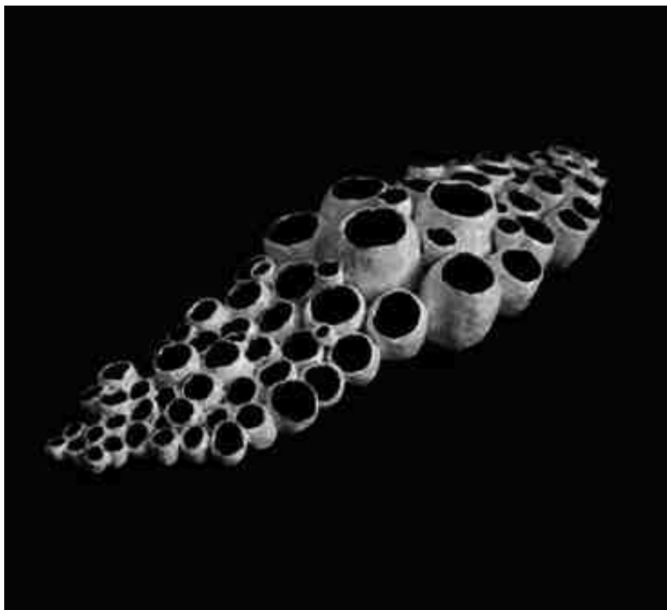
Arriba: Antonio Cobos. "Bajo el yunque", 2018. 37 x 31 x 13 cm. Exposición "Llamaradas", CERCO 2018. Abajo: Eloy Moreno. "Orgánico". 6 x 54 x 17 cm. Exposición "Llamaradas", CERCO 2018.