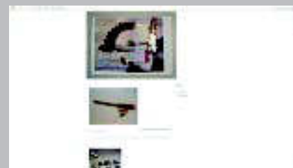
Jimena Mendoza http://jimenamendoza.blogspot.com.es