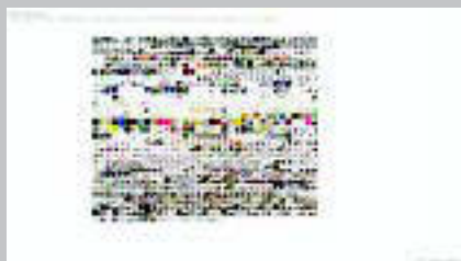
Richard Deacon www.richarddeacon.net