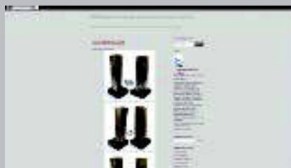
Katilu Blogspot http://katilu.blogspot.com.es