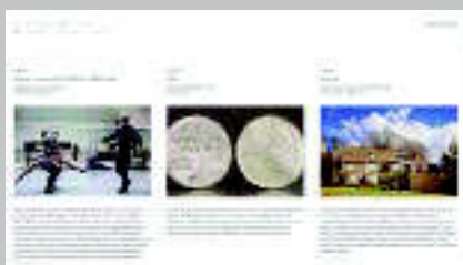
Edmund de Waal www.edmunddewaal.com