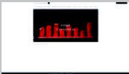
Jesús Castañón www.jesuscastanonloche.com