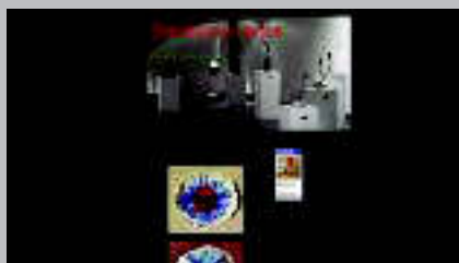
Domingo Huertes www.domingohuertes.com