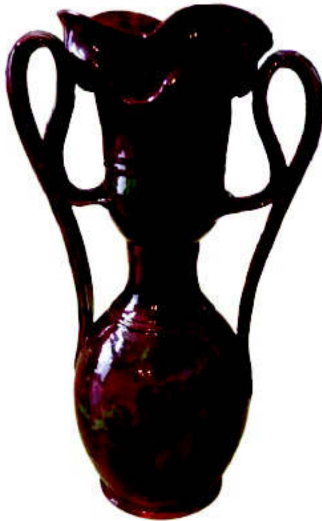
George Ohr. Boca Raton Museum of Art, Estados Unidos.

520 N. Main Street Ann Arbor MI 48014 www.dinnerwaremuseum.org