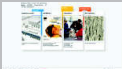
Museo de la Bauhaus www.bauhause.de