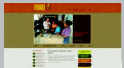
Potters for Peace www.pottersforpeace.org