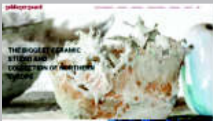
Centro Internacional de Cerámica www.ceramic.dk