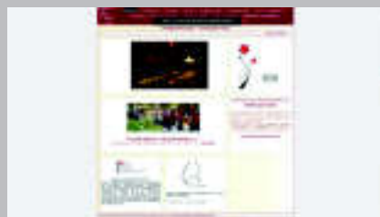
Cerámica en Francia www.ceramique.com