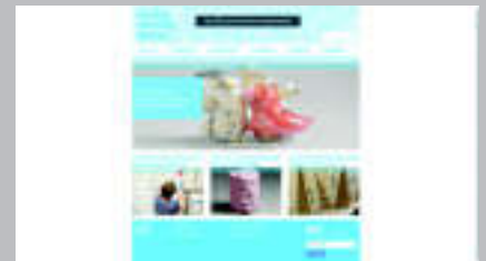
Centro Europeo de Cerámica www.ekwc.nl