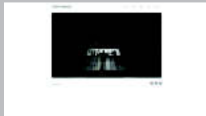
Clare Twomey www.claretwomey.com