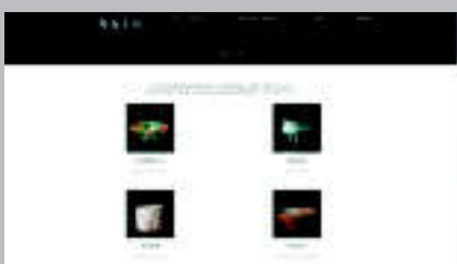
Takiya Art Museum www.takiya-art.co.jp