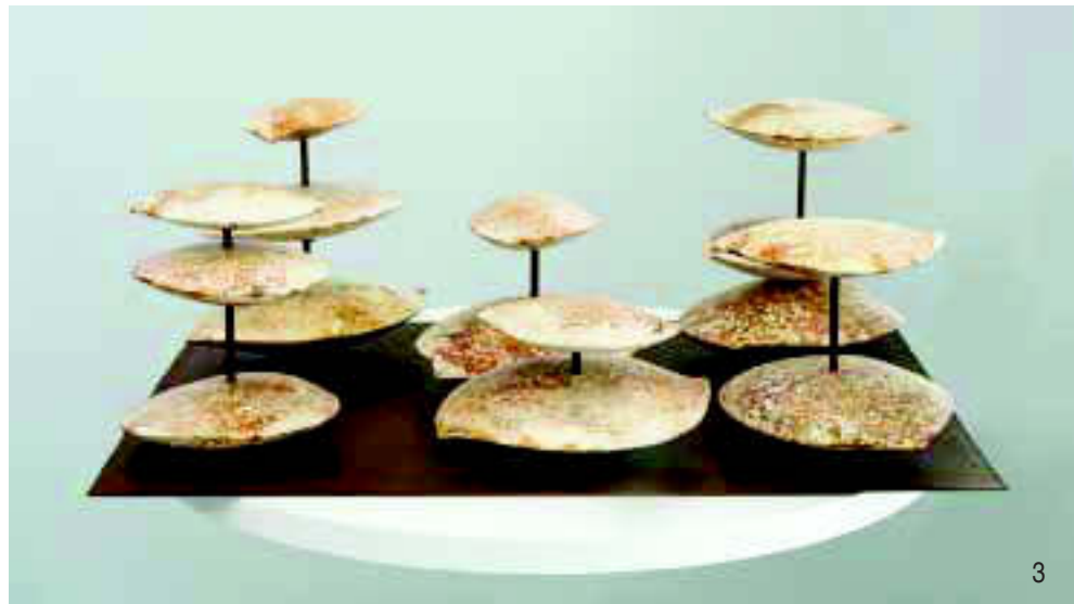
Foto 1: Isabel Alfaro. "Yo< >Yo". Primer Premio de la Bienal Internacional de Cerámica de El Vendrell (Tarragona). Foto 2: Silvia Granata. "23". Tercer Premio de la Bienal Internacional de Cerámica de El Vendrell (Tarragona). Foto 3: Rafaela Castro. "Jardín etéreo". Premio Local del Concurso de Alfarería y Cerámica de La Rambla (Córdoba).

Los premios de Cerámica artística son de creación libre y el de diseño de producto cerámico puede ser artesanal o industrial. La entrega de premios se hará el 10 de noviembre de 2017 ( www.manises-bienal.com ).