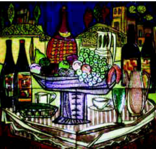
Arriba: Fernando Arranz. Izquierda: Fernando Arranz. "Naturaleza muerta", 68 x 70 cm.

Vladimír Tsivin consigue dotar a sus esculturas cerámicas, básicamente torsos o figuras, de una enorme fuerza circundante, son figuras que sugieren un movimiento, un enfrentamiento o una proximidad corpórea, cuerpos de apariencia masiva, casi ciclópea, tal como veíamos en el núm. 14, pág. 26 de esta revista, participando en el Concurso de Faenza en 1982. Un torso sencillo y poderoso visualmente nos permitió admirar sus esculturas cerámicas, también gracias a su participación en el Concurso de Faenza de 1985, donde la U.R.S.S. mostraba lo mejor de su cerámica a Occidente (pág. 56, núm. 20). Ya en 1990 en la exposición itineran- >