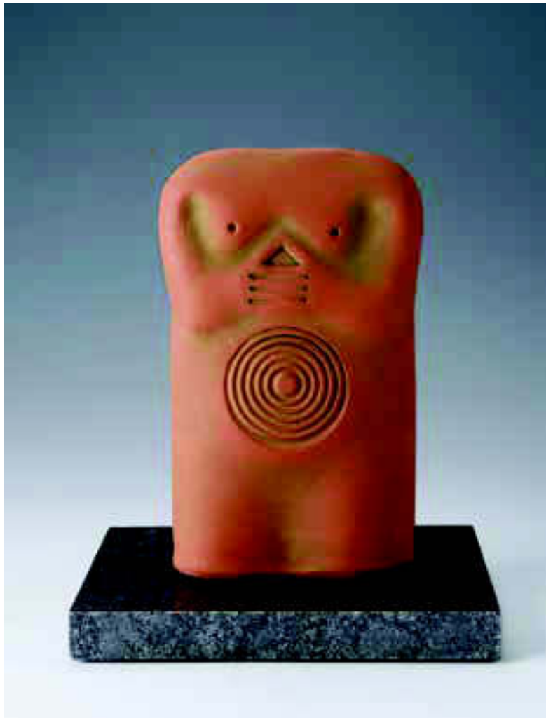
Arriba, a la izquierda: Vladimir Tsivin. "Adam and Eve III". Arriba, a la derecha: Vladimir Tsivin. "African Couple". Derecha: Vladimir Tsivin. "Neolithic Venus III".