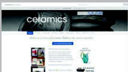
Ceramics Monthly www.ceramicsmonthly.org