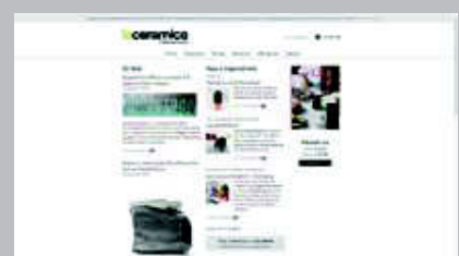
La Ceramica in Italia www.laceramicainitalia.com