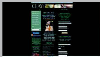
Clay Times www.claytimes.com