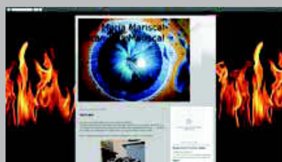
Cerámica José Mariscal www.ceramicajosemariscal.blogspot.com.es