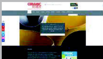
Ceramic Review www.ceramicreview.co.uk