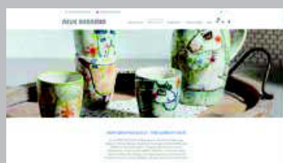
New Ceramics www.new-ceramics.com