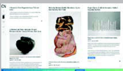
Ceramics Now www.ceramicsnow.org