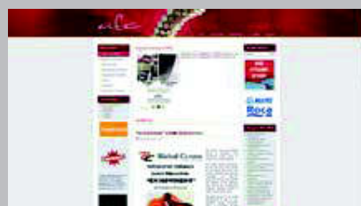
Associació Ceramistes de Catalunya www.ceramistescat.org